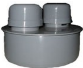
Клапан вентиляционный канализационный