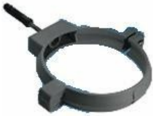
Хомут с защелкой и креплением