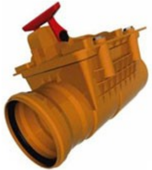
Обратный клапан – ревизия